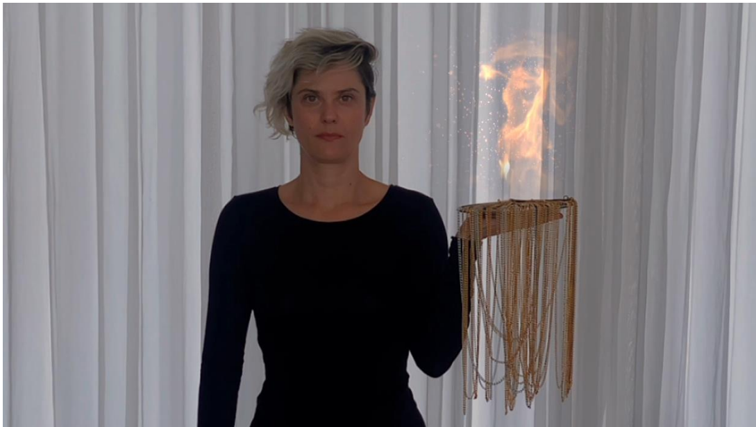
Honor to merit, 2023, vídeo II, 10'48"